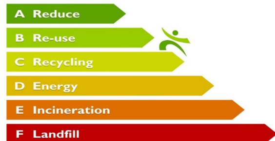
LANSINK'S LADDER - THE WASTE HIERARCHY