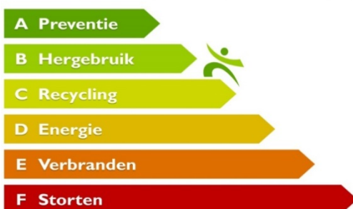
LADDER VAN LANSINK - DE AFVALHIËRARCHIE